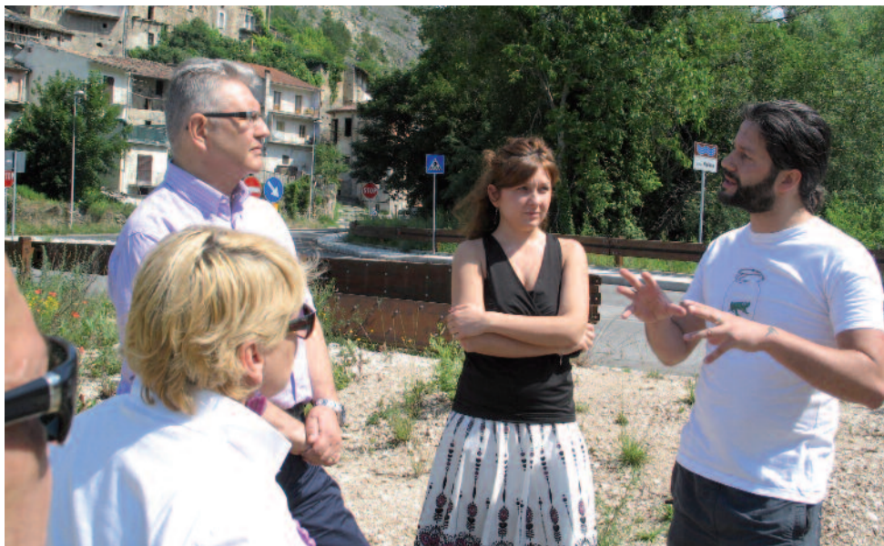
Gli amministratori di Vimodrone con i responsabili della ricostruzione di Camarda

descrive i primi momenti della sua presenza a L'Aquila, dopo il terremoto che ha colpito il capoluogo abruzzese alle 3.32 del 6 aprile 2009.