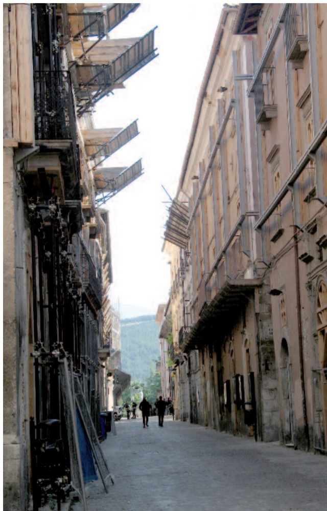
Il centro storico dell'Aquila